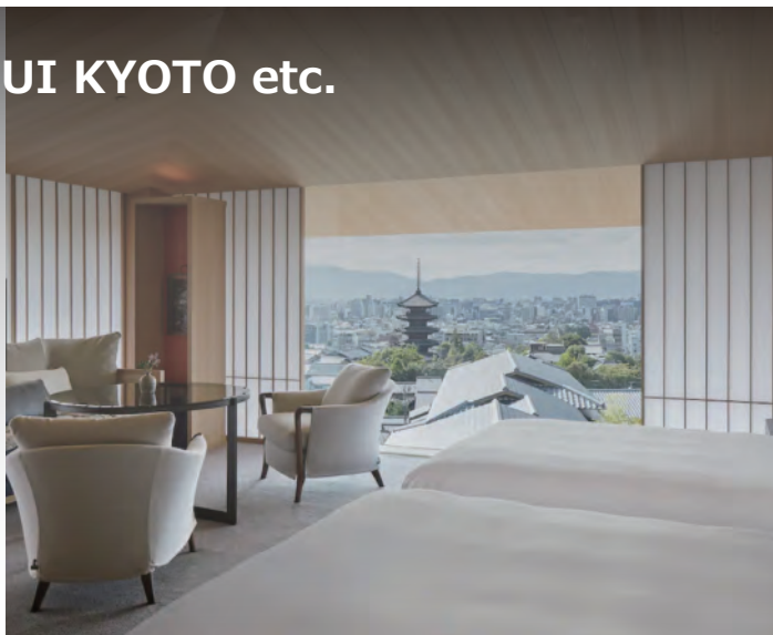
パーク ハイアット 京都