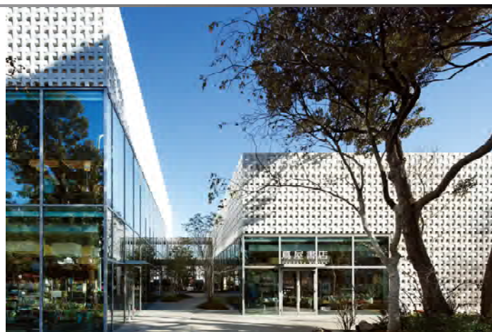
代官山T-SITE / 蔦屋書店