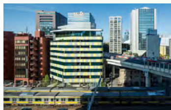
toggle hotel suidobashi