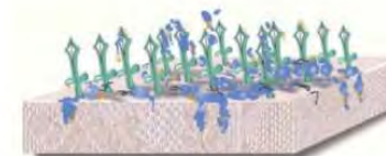
生地表面状で破壊された菌