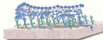
Shield Plusの生地を拡大した分子構造

生地表面を水素、炭素、シリコン、窒素などを重合反応させることで分子を無数の針のように加工、それら分子の針にはプラス電子を帯電させます。一方、菌（ウイルスなど）はマイナス電子が帯電されているためプラス電子に引き寄せられ、針が刀のように菌を突き刺し物理的に破壊するというもの。1つの菌に対して、約25本の針が対応、1時間以内に分解（感電・分解死）させます。もちろん、針といっても分子レベルのため見た目では判別できませんし、手で触ってもわかりません。